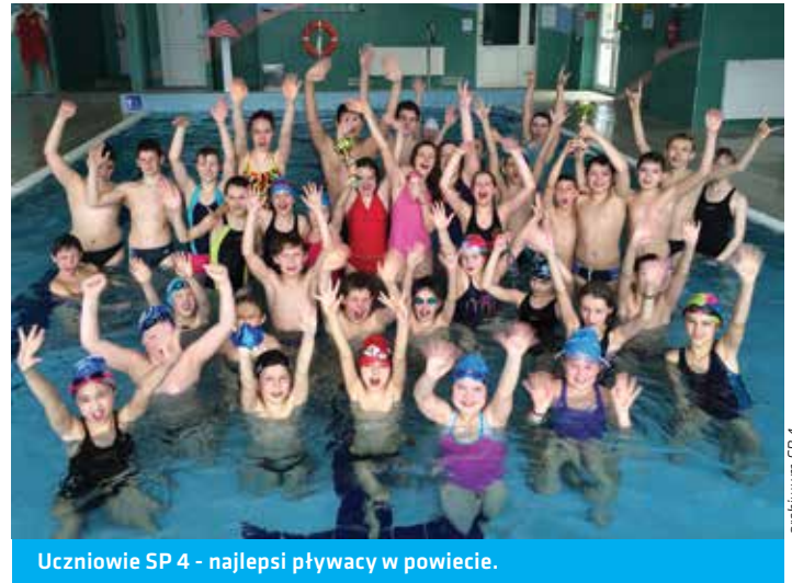
Uczniowie SP 4 - najlepsi pływacy w powiecie.