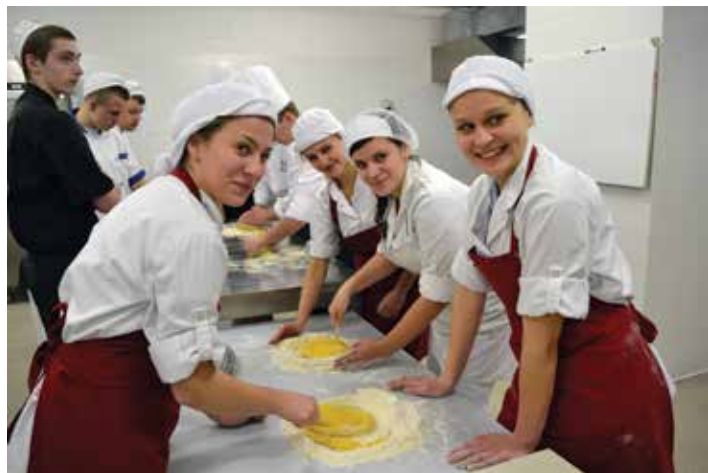
Tematem przewodnim warsztatów kulinarnych była kuchnia włoska.

Do udziału w projekcie zaproszono także szkoły z Węgier (Budapest Business School), Słowacji (Hotelová Akadémia Bratislava), Czech (Praktik, Střední Škola Obchodu a Gastronomie Praktik s.r.o. Olomouc) oraz Włoch (Centro di Formazione Professionale Ristorazione e Turismo-Udine). Program tego międzynarodowego spotkania był bardzo urozmaicony. Brałyśmy udział w warsztatach gastronomicznych, podczas których przygotowywane były potrawy kuchni włoskiej. Poznawałyśmy zwyczaje żywieniowe naszych sąsiadów. Każda ze szkół przygotowywała prezentację o swojej szkole i regionie oraz wykonywała i serwowała regionalne menu podczas uroczystej Gala Diner, która odbyła się w sali D'Arme Palazzo Vecchio we Florencji. Na zakończenie tego miłego pobytu w Toskanii organizatorzy zabrali nas na wycieczkę do winnicy Antinori produkującej od 27 pokoleń Chianti