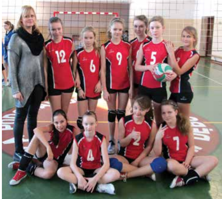
Wicemistrzyni powiatu w mini piłce siatkowej.