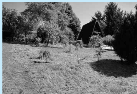
Działka przy ul. Mickiewicza przeznaczona do dzierżawy.

Burmistrz Miasta Cieszyna ogłasza II ustny przetarg nieograniczony na zagospodarowanie w formie dzierżawy z przeznaczeniem na cel rekreacyjny nieruchomości Gminy Cieszyn.