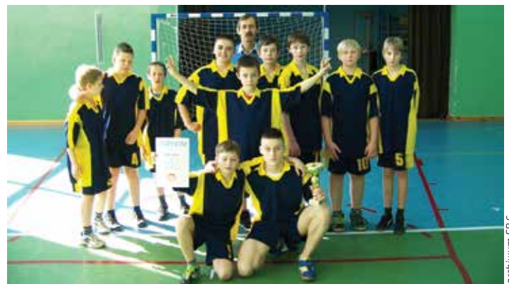
Mistrzowska drużyna chłopców z SP 6.