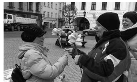
W Dzień Kobiet panie na Rynku dostawały ręcznie robione kwiaty.